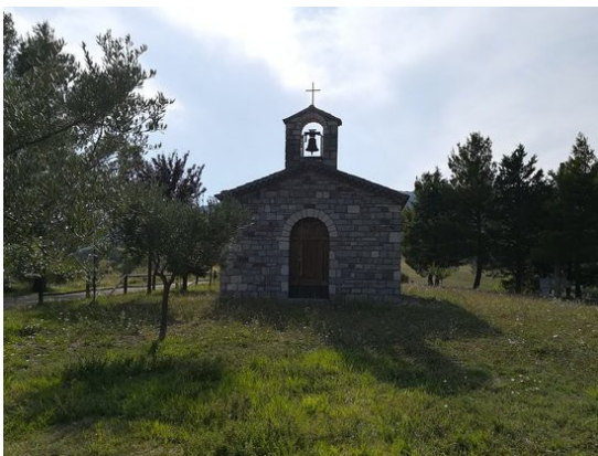
Immagine presa da Internet.

Il tempo passò e in men che non si dica il nuovo Santuario fu pronto e da allora fu sempre festa per venerare la Madonna.