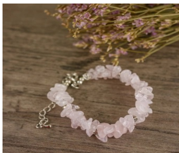
Immagine presa da Internet.