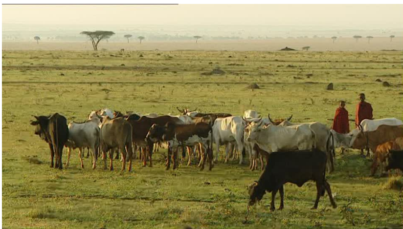
Immagine presa da Internet.