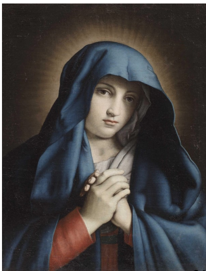
Immagine presa da Internet.